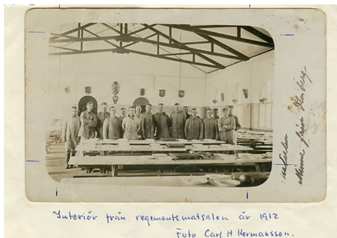
Interiör från regementsmatsalen år 1912

I början av 1960-talet gick regementet från artilleri till luftvärn. LV6, som det hette, låg från början där Högsbo sjukhus finns idag. Under beredskapen flyttade delar av regementet ut till Kviberg för att sedan officiellt flytta in 1962. Då blev det som förr tjänade som ridhus istället pjäshall, där man förvarade och övade sig på luftvärnskanoner. Men som många andra regementen hotades LV6 av nedläggning. Så blev dock icke fallet, 1994 flyttade LV6 istället till Halmstad där det fortfarande finns kvar.